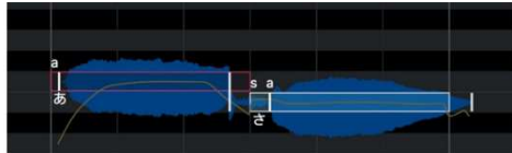
タイミングツール：音素タイミングを調整