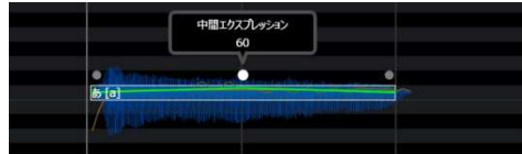
エクスペッションツール：強弱を調整