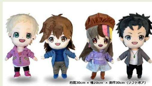
約高30cm x 幅20cm x 奥行30cm (ソフトボア)