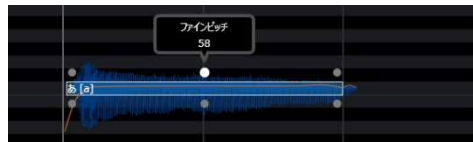
ピッチツール：ピッチを調整

ボーカリストに素早くオーダーを伝えるための新しい編集ツールを用意しました。アクセント、ビブラート、タメなどを自在に操り、唯一のボーカルトラックを作ることができます。